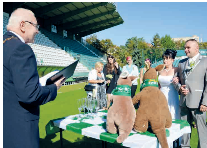
Svatba na Bohemce. Chystáte se na svůj zásadní životní krok a nechcete prožít jen neosobní obřad? Důlčice je magická alternativa.