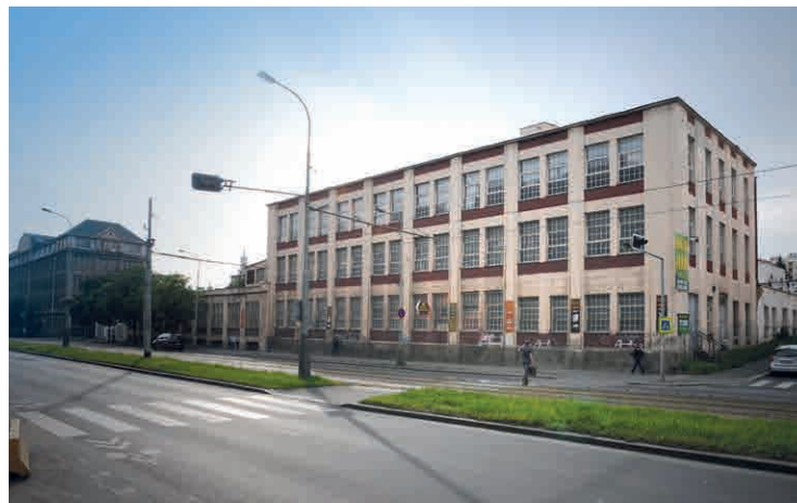
Červen 2014 Budova bývalé Tesly Vršovice, Vršovická 627/55, vlevo Koh-i-noor. Takto vedle sebe stály i před sto lety. Tehdy továrna na obuv Helia a Waldeska.

Je to dlouhých sto let, co Pražané denně chodili a jezdili kolem nedávno zbořené tovární budovy, která od roku 1915 v takřka nezměněné podobě stála přímo proti dnešnímu ÚMČ Praha 10. Spo-