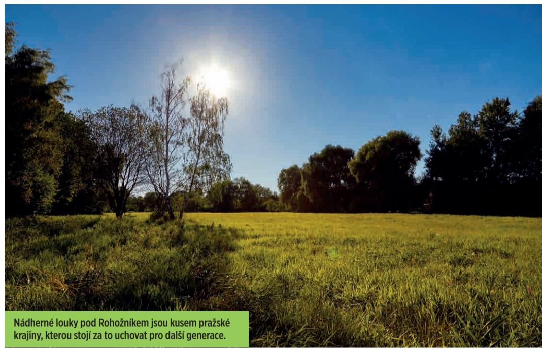
Nádherné louky pod Rohožníkem jsou kusem pražské krajiny, kterou stojí za to uchovat pro další generace.