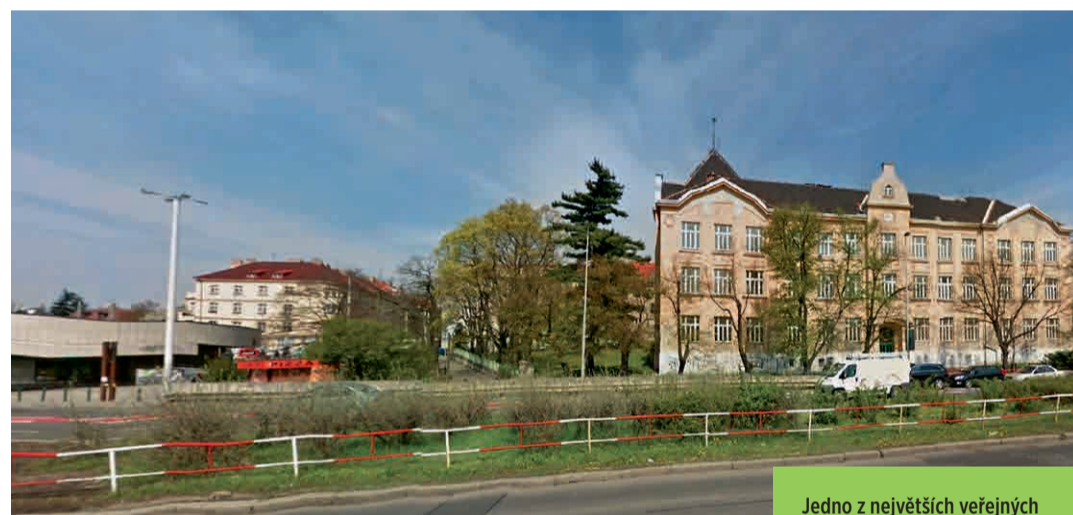
Jedno z největších veřejných setkání na Praze 10 se týkalo lokality Strašnická. Výsledky skončily v šuplíku.