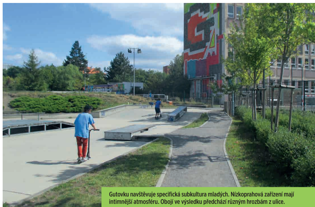
Gutovku navštěvuje specifická subkultura mladých. Nízkoprahová zařízení mají intimnější atmosféru. Obojí ve výsledku předchází různým hrozbám z ulice.

V oblasti Vršovic poslední léta působí terénní pracovníci, kteří uskutečnili několik set kontaktů s mladými lidmi, trávicími volný čas rizikovým způsobem. Kdyby přitom mohli být jinde než