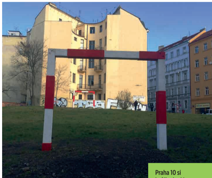
Praha 10 si kvůli minulému vedení radnice dala v horních Vršovících gól do vlastní branky.

Projekt „Moje stopa“. Sledujte na: verejneprostory.cz/aktivity-a-verejne-prostory/participace/participativni-rozpocet-moje-stop.aspx