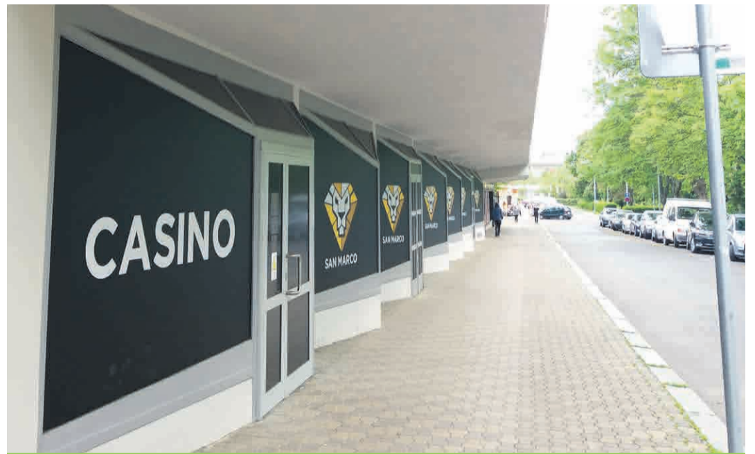
Kasino v Turnovského ul. mají na očích děti chodící do ZŠ Brigádníků. Přijďte na diskusi o hazardu v Praze 10 – 12. 6. v 17 hod. v kanceláři senátorky, Kubánské nám. 4.