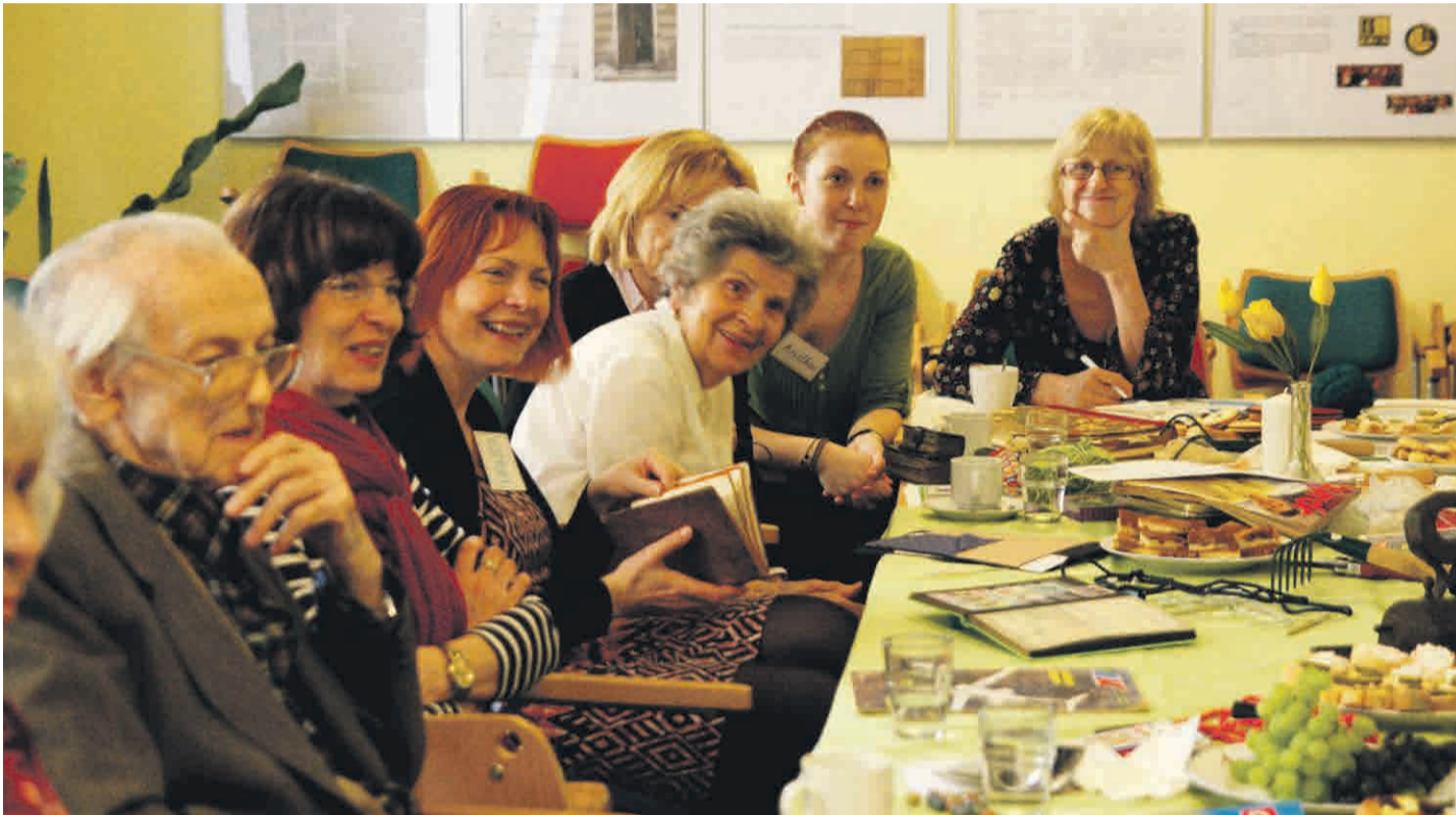
Radost, soběstačnost a vzájemná blízkost. Společné vzpomínání vrací člověku důstojnost a místo v lidském společenství. Propojuje se svět těch, o něž je pečováno, se světem pečujících.