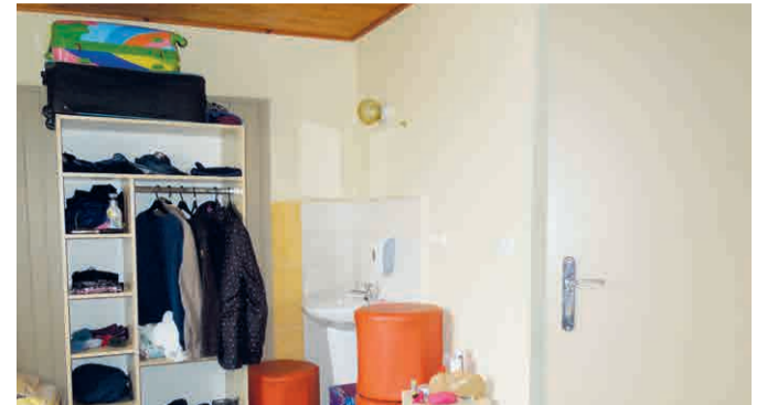
Zde pokoj pro děti – povšimněte si skříně bez dveří...