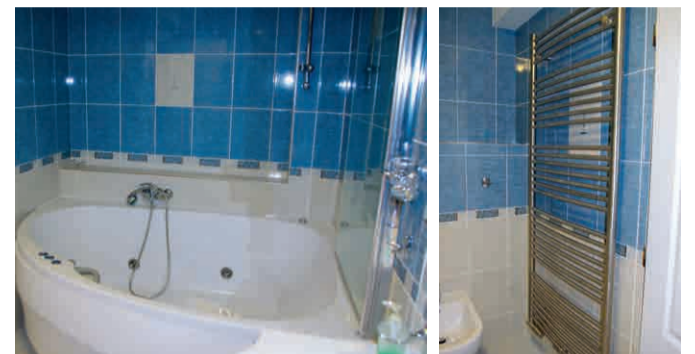
A zde pokoj č. 24 pro „VIP návštěvy“ z Prahy 10, s hydromasážní vířivou vanou, bidetem, LCD TV, lednicí a dalším luxusním vybavením. Existenci pokoje nechtěl provozovatel při návštěvě objektu v listopadu 2015 zprvu vůbec přiznat!