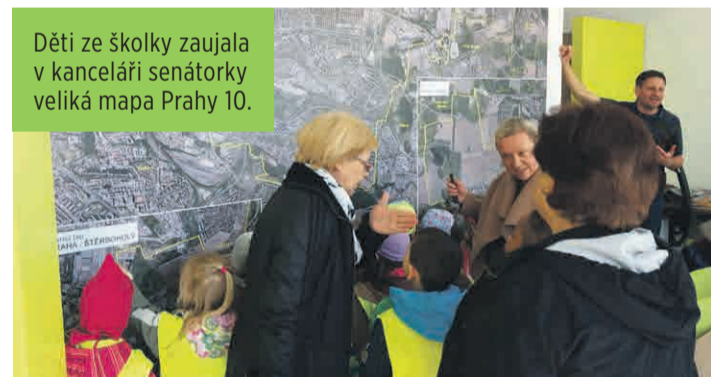
Děti ze školky zaujala v kanceláři senátorky velká mapa Prahy 10.

Zúčastnila se všech 6 dosavadních zasedání Senátu, 6x vystoupila na plénu, hlasovala 209x. Prostudovala více než 130 senátních tisků, desítky usnesení výborů a komisí, řadu pozměňovacích návrhů a důvodových zpráv k zákonům. Je transparentní. Na webu www.renatachmelova.cz zveřejnila své finanční a majetkové poměry.