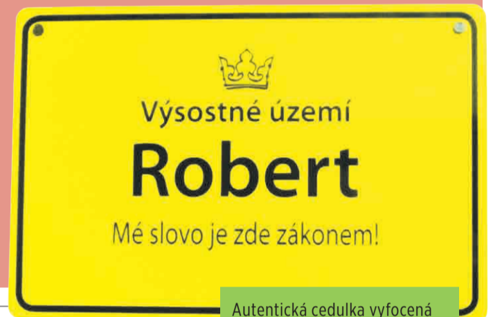
Autentická cedulka vyfocená přímo v Horském hotelu. Vzhledem k podmínkám, které provozovatel má, těžká ironie...