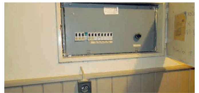
Důkaz neopravené elektroinstalace. Za více než 5 milionů!!